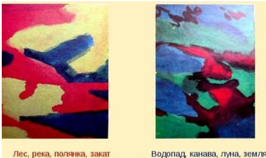
Рис. 2 Пример выполненного задания "Три краски".